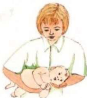
рис 3. Положение лежа на боку