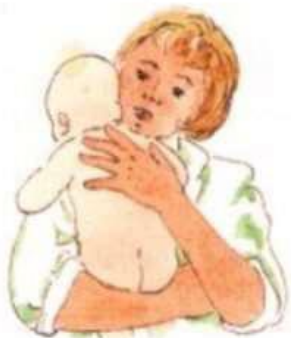
рис 1. Положение щекой к шее (первый вариант)