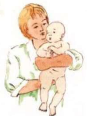
рис 2. Положение щекой к шее (второй вариант)